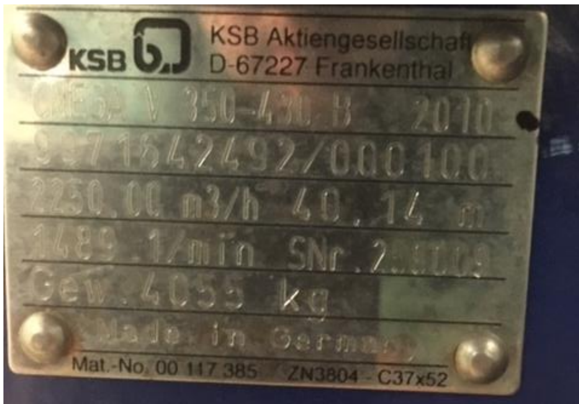
Oběhové čerpadlo č. 1 vč. 259009