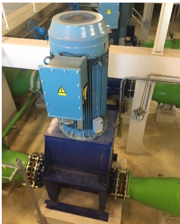
Oběhové čerpadlo č. 1

V případě zájmu o některé z čerpadel kontaktujte Jana Voneše, vedoucího MTZ a vnitřních služeb e-mail: vones@teplarna-cb.cz tel. +420 777 939 300