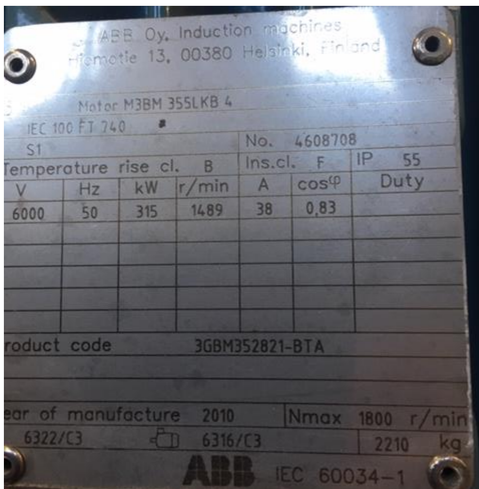
Motor oběhového čerpadla č. 1