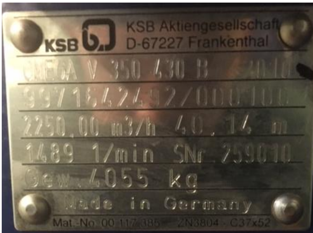
Oběhové čerpadlo č. 2 vč. 259010