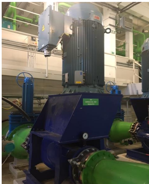
Oběhové čerpadlo č. 2